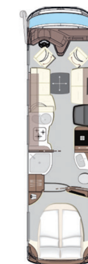
Charisma 910 MI