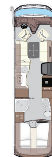
Charisma 910 LSI